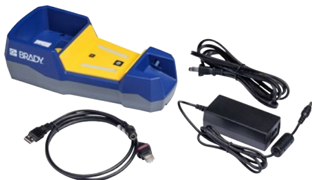
De V1300 kit bevat een basisstation, AC-adapter, USB-kabel en stroomkabel