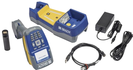
De V4500 kit bevat een lezer, basisstation, AC-adapter, USB-kabel en stroomkabel