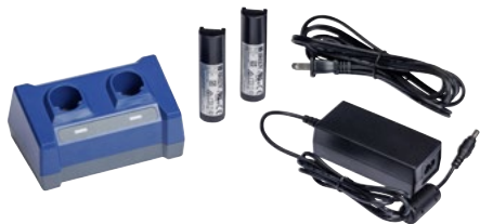
De V1100 kit bevat een reservebatterijlader, twee batterijen, een AC-adapter en een stroomkabel