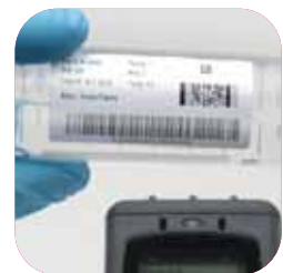
Identificatie in laboratoria en in de gezondheidszorg